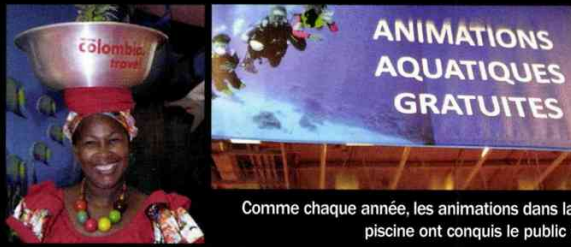
Comme chaque année, les animations dans la piscine ont conquis le public !