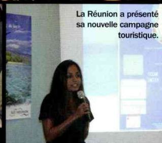
La Réunion a présenté sa nouvelle campagne touristique.