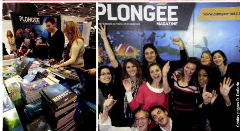
Merci à tous d'être venus nous rencontrer sur le stand de "Plongée Magazine" !