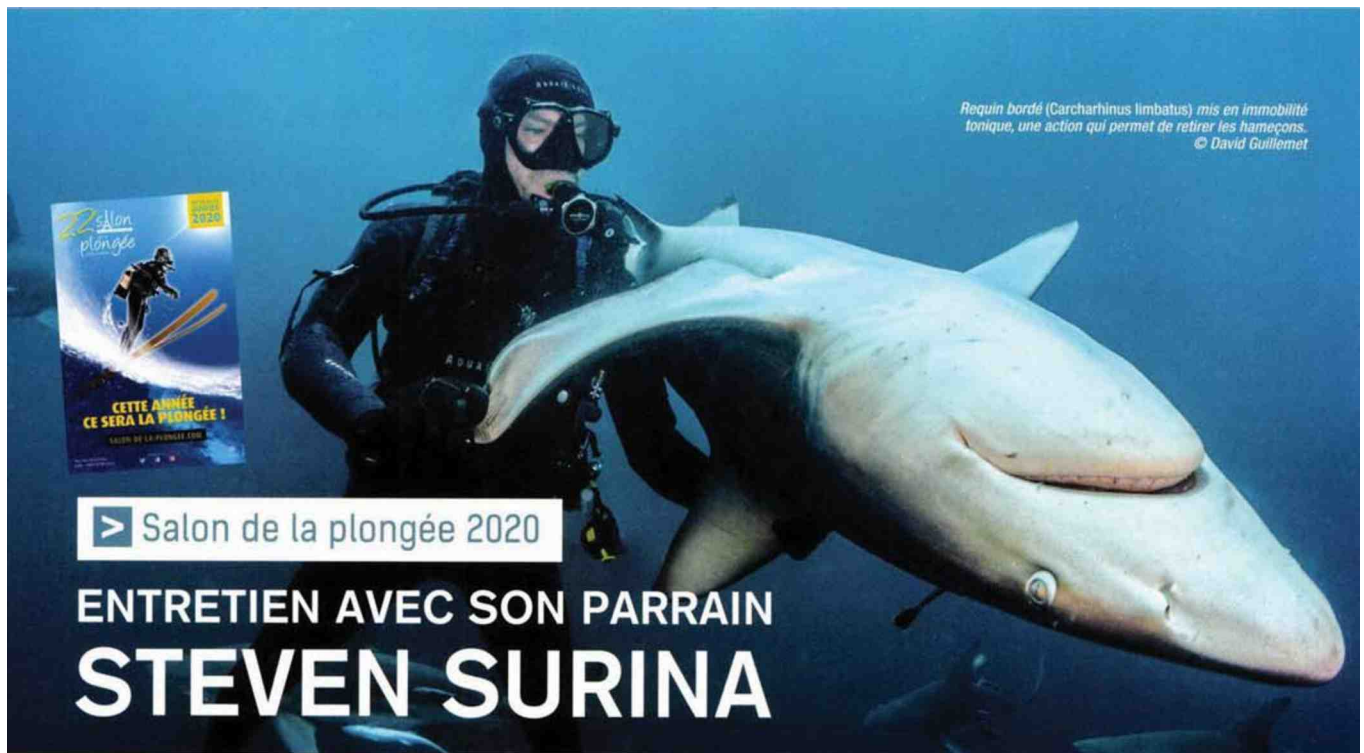
Requin bordé (Carcharhinus limbatus) mis en immobilité tonique, une action qui permet de retirer les hameçons.