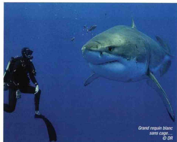
Grand requin blanc sans cage...

S. Surina La nouvelle génération faisant grand usage des réseaux sociaux, communiquer, en particulier sur une activité aussi visuelle que la plongée, passe à mon avis par la publication régulière d'images. Mon idée est donc de captiver et attirer vers la plongée les 20/40 ans à travers des vidéos très courtes, d'une minute pas plus. Des clips rythmés, à la fois ludiques et plaisants, et abordant un maximum de thèmes différents : plonger avec les animaux - requins bien sûr, mais aussi dauphins, mantas, baleines... -, découverte d'épaves, le tek, etc. Comme j'ai l'opportunité de beaucoup voyager, les idées de sujets ne manquent pas et j'ai d'ailleurs déjà réalisé une première série à voir dès maintenant sur les comptes Instagram et Facebook du Salon de la plongée .