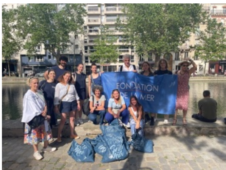
Un geste utile.

Une quinzaine de personnes se sont donc donné rendez-vous le 27 juin dernier, sur les Quais de Valmy, à Paris, pour initier une première collecte. Au final, une douzaine de kilos a été ramassée, principalement des mégots de cigarette.