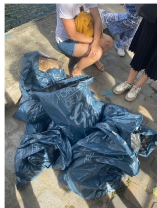
Résultat : une douzaine de kilos.

Crédit photo : KMG Travel 360 pour le Salon International de la Plongée Sous-Marine