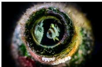
1 er prix : Annick Murgier Un habitat original