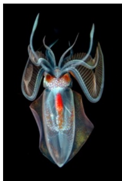
1 er prix : André Moyo Le diamant des profondeurs