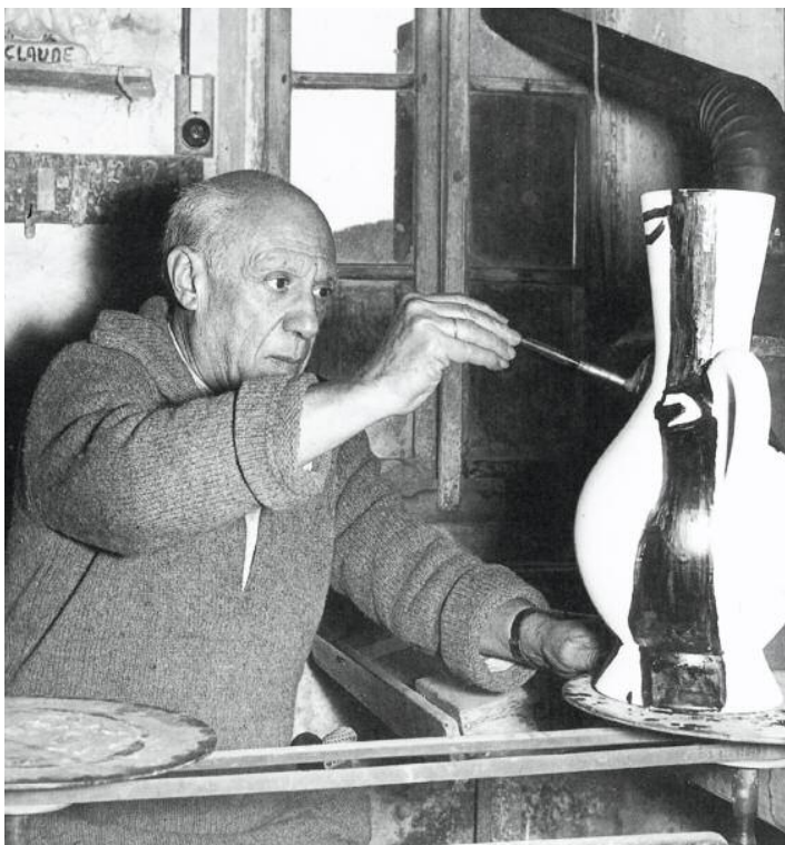
illustration : Picasso chez Madoura