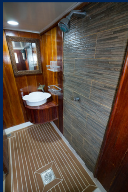
SALLE DE BAIN TOILETTE PRIVEE